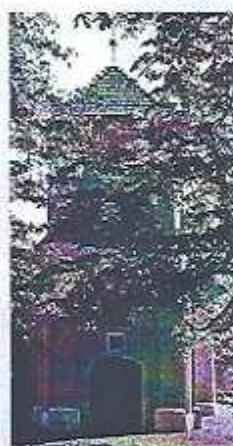
Kaplica św. Zofii